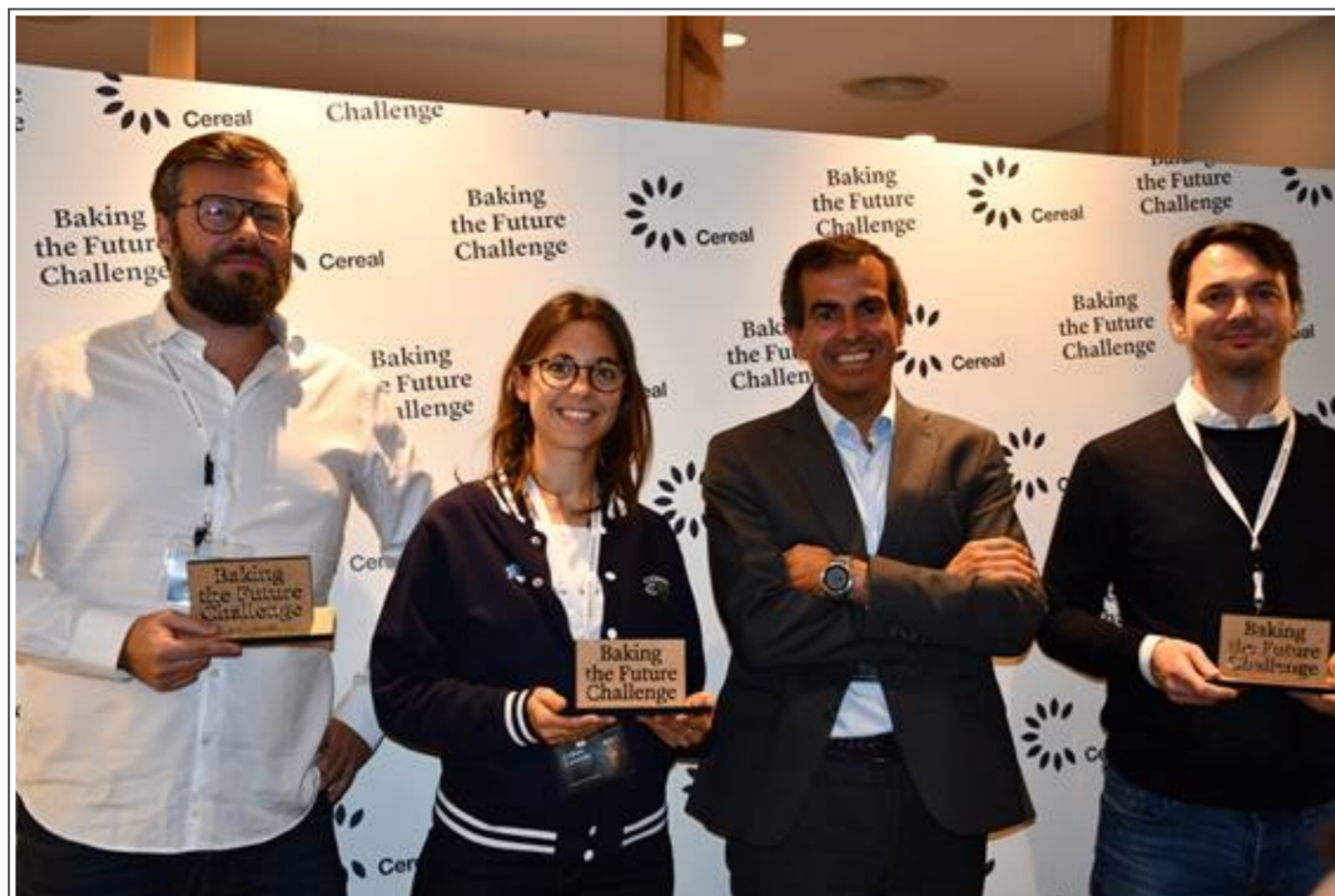
'Connecting Food', 'startup' ganadora del concurso de innovación 'Baking the Future Challenge' de Europastry

13 septiembre, 2019 blockchain Europastry innovacion innovacion en panaderia inteligencia artificial startup